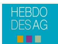
L'Hebdo des AG